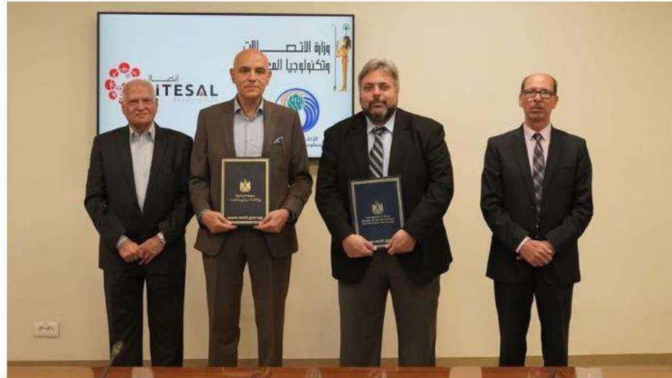
تعاون بين اتصال والأكاديمية الوطنية لتكنولوجيا المعلومات